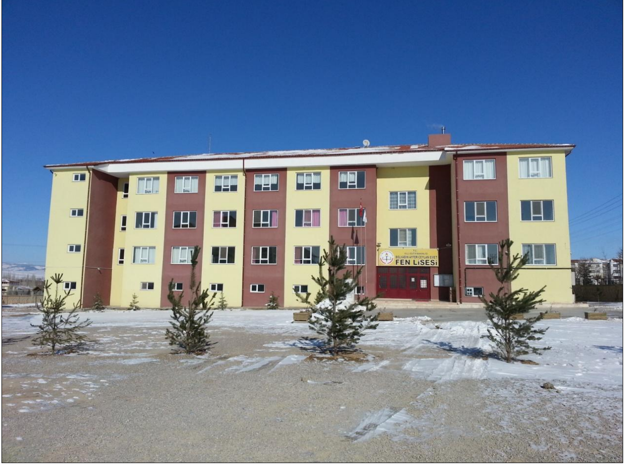
Ayfer-Ceylan Emet Fen Lisesi